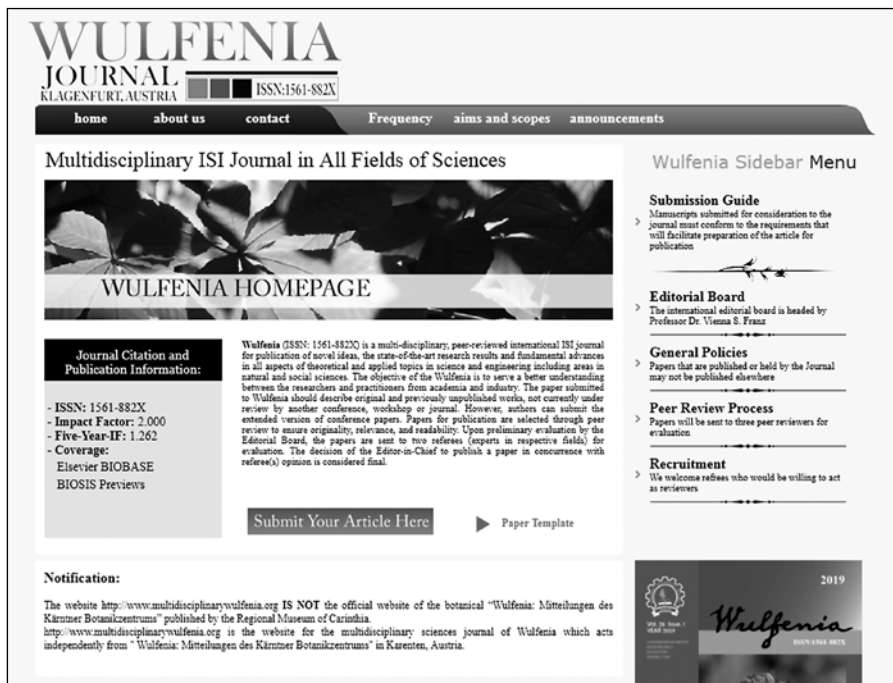
Obrázok 3. Hijacked journal – Falošná stránka časopisu Wulfenia